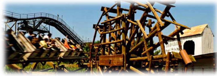
Tren de la mina