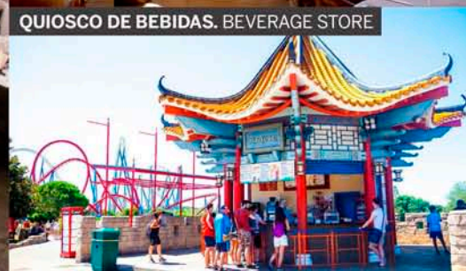
QUIOSCO DE BEBIDAS. BEVERAGE STORE