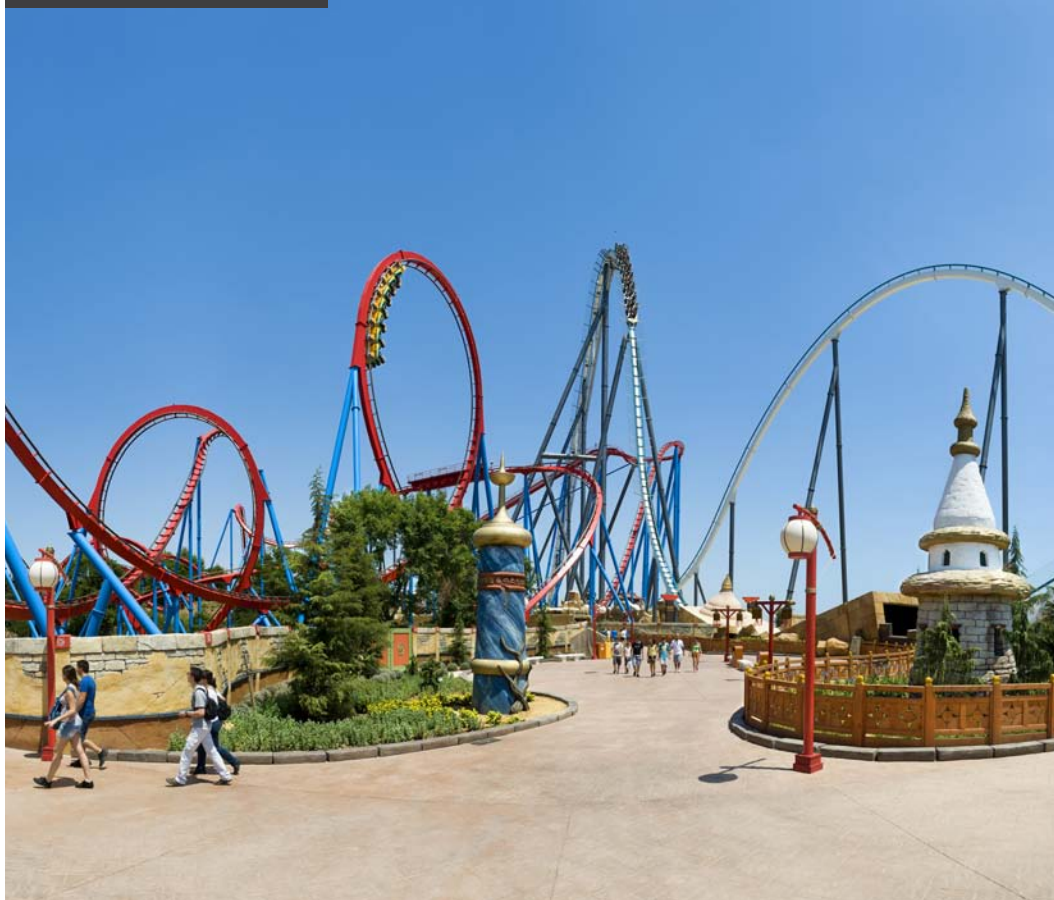
SHAMBHALA / DRAGON KHAN

Shambhala. Sus 76 metros de altura la convierten en la montaña rusa más alta y con la caída más larga de Europa. Measuring 76 metres tall, this roller coaster boasts the longest drop and is the highest in Europe.