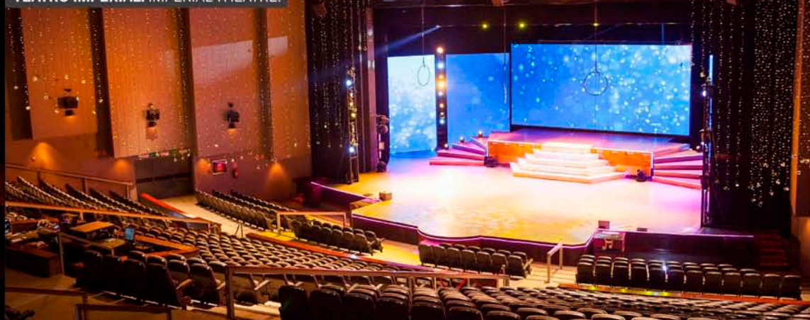
TEATRO IMPERIAL. IMPERIAL THEATRE.